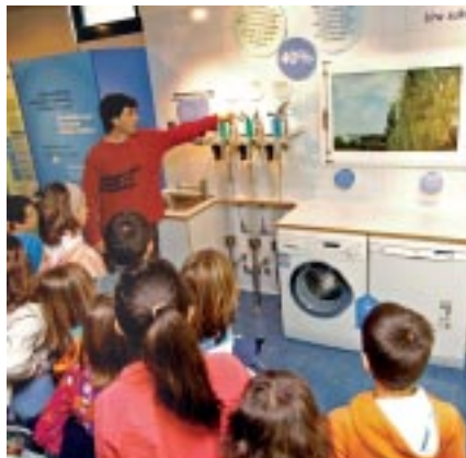
Erakusketa "Uraren erabilera eragingarria" Egillorren.

Bisita: Artetako iturburua + "Lupeko urak" Interpretazio Zentroa