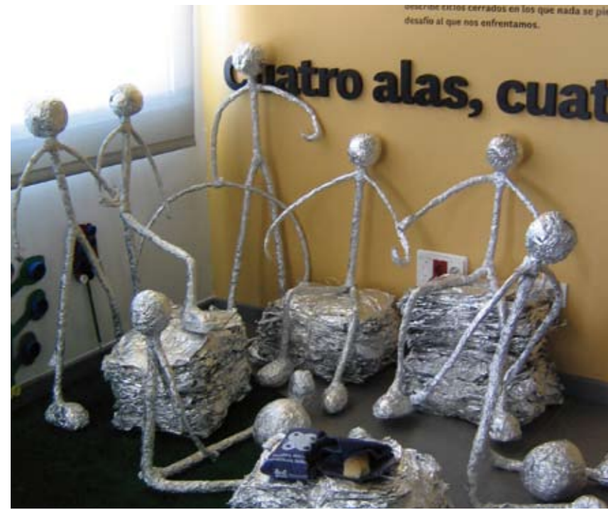
Catalina de Foix ikastetxe publikoak utzitako eskulturak